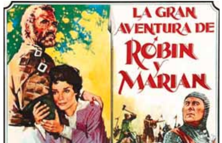
Detalle del cartel en castellano de la película.

También podrá visitarse de manera online, a través del micrositio web del Archivo Real y General de Navarra y físicamente permanecerá abierta en la cripta protogótica del Archivo de Navarra todos los días de mayo de 10.00 a 14.00