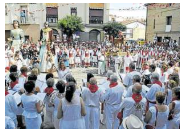
Marcilla, en sus fiestas de 2017.

—Después de 35 años de funcionario estoy intentando dejar el derecho, todo tiene su tiempo y es bueno cambiar de actividad de vez en cuando por higiene física y mental. También estoy tomando distancia con la política. Creo que es muy sano, para la política y para uno mismo, estar solo algunos años con dedicación intensa. Mi propósito para el futuro es ejercer solo de ciudadano y de afiliado de a pie de Izquierda Unida, ya en la reserva. La actual situación política me tiene muy preocupado, como a cualquiera, pero ahora son otros los que tienen que estar en primera línea. Yo me estoy centrando en la literatura y en el único cargo que tengo, que es el de secretario de la Asociación Navarra de Escritores/as. ●