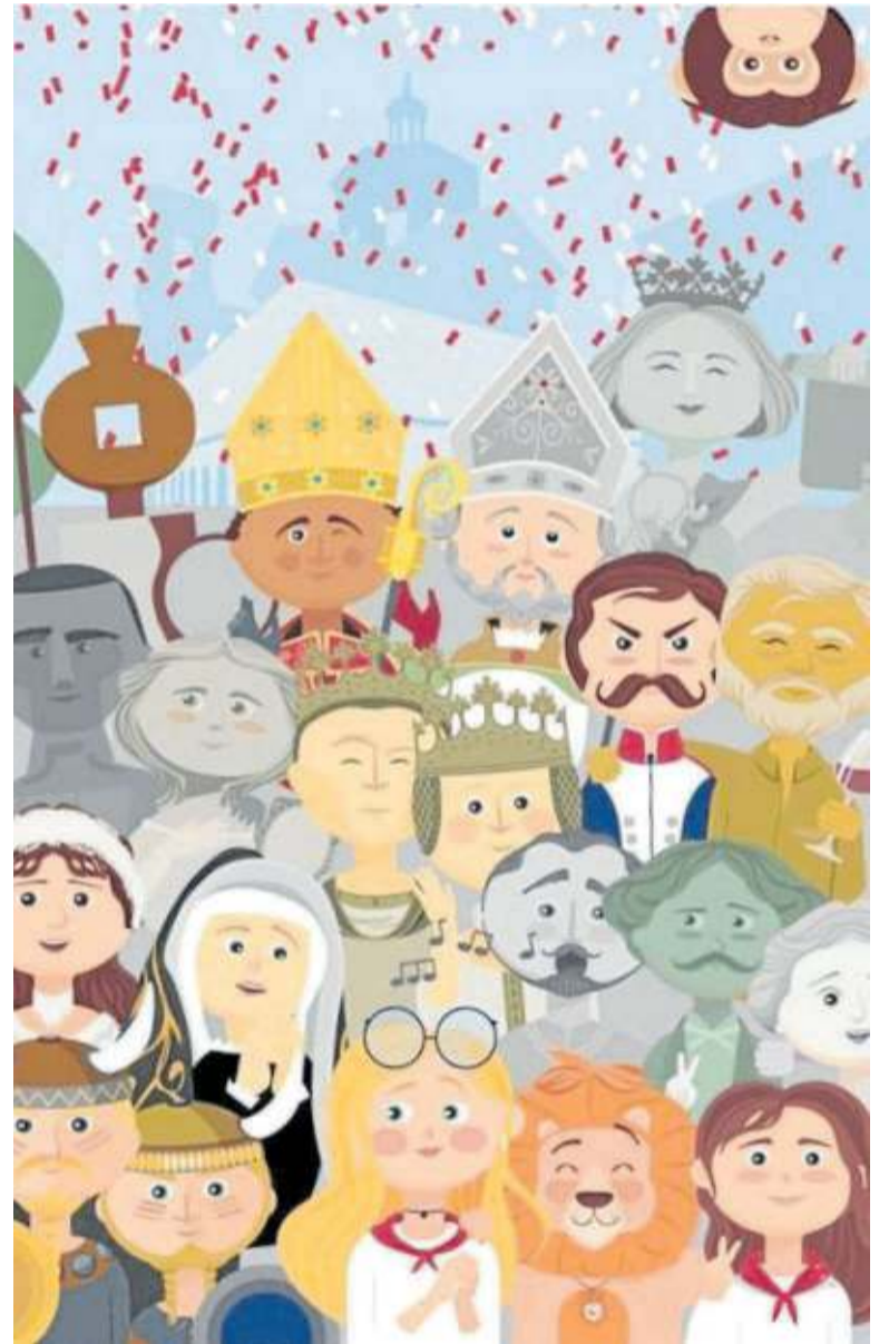
Ilustración de los personajes de 'El secuestro de San Fermín'.